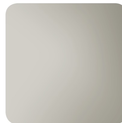
Inox Satin (2B)