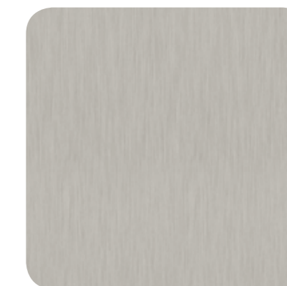
Brushed Natural Aluminium – H 9161 S