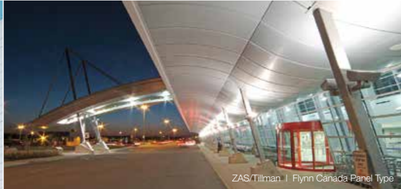
ZAS/Tilman | Flynn Canada Panel Type