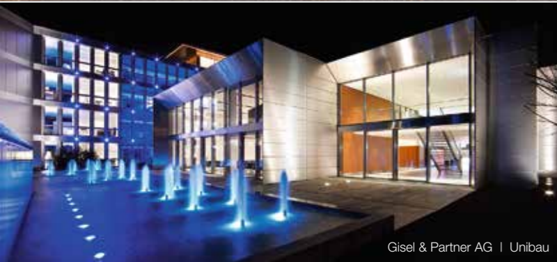
Gisel & Partner AG | Unibau