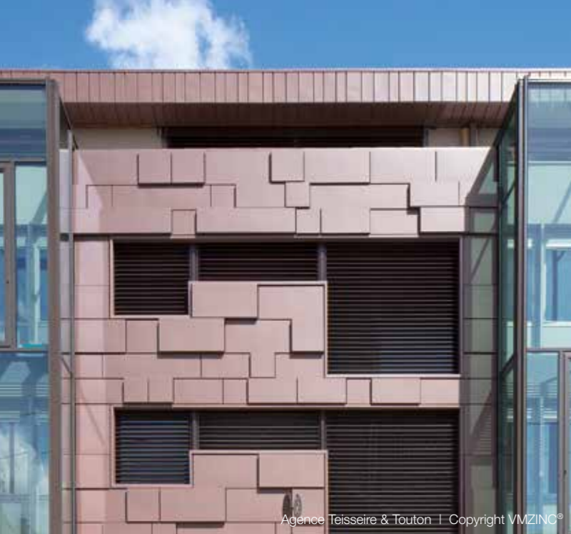
Agence Teisseire & Toutou | Copyright VMZINC®