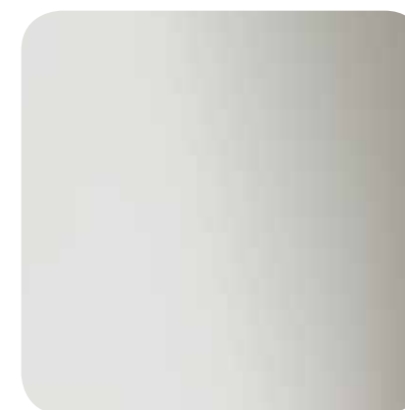
Inox Bright (BA)