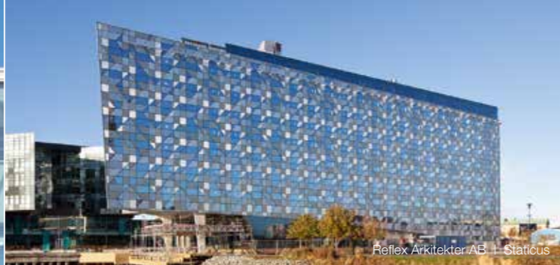
Reflex Arkitekt AE | Statiscus