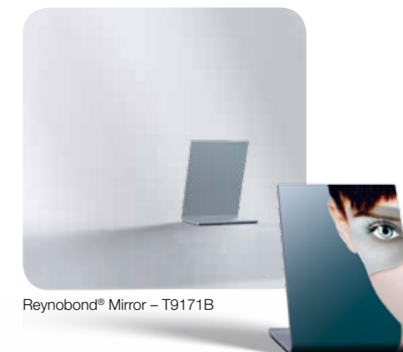
Reynobond® Mirror – T9171B