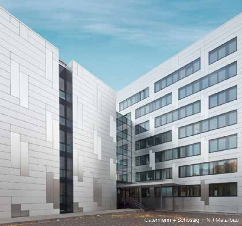
Gatermann + Schössig | NR Metallbau