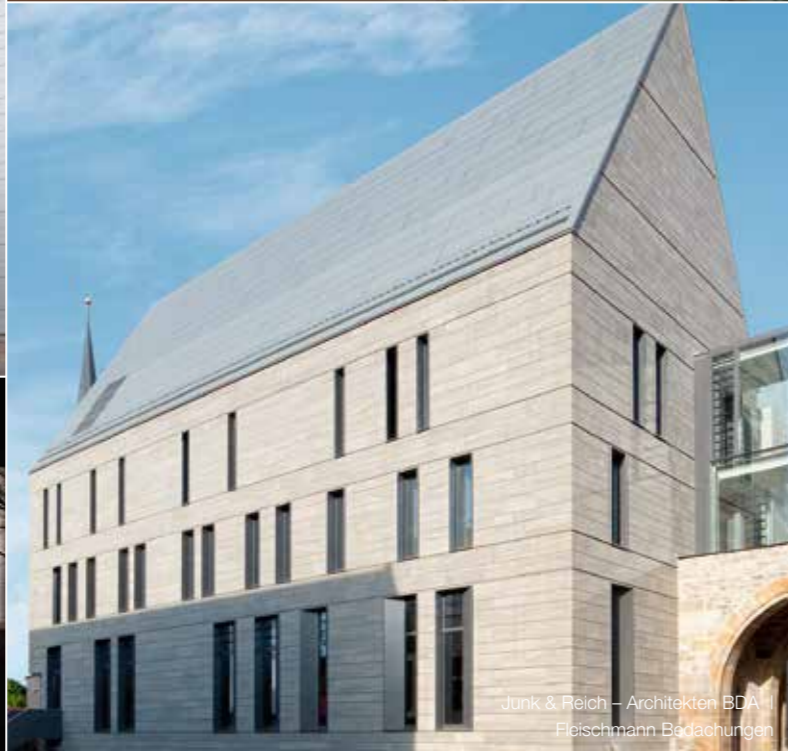
Junk & Reich – Architekten BDA Fleischmann Badashurgen