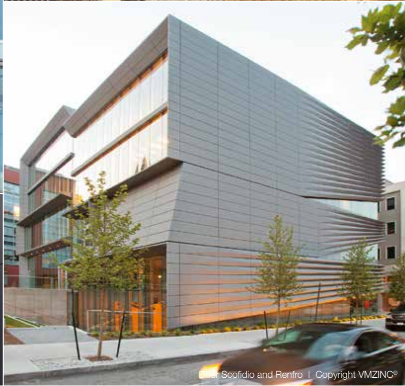
Scofidio and Renfro | Copyright VMZINC®